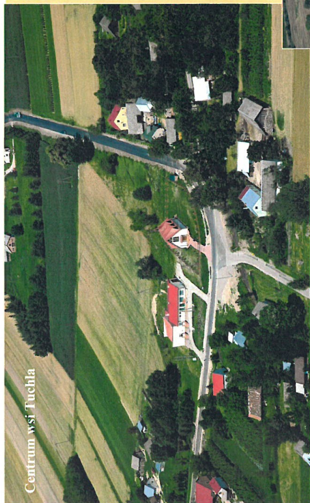
Centrum wsi Tuchla